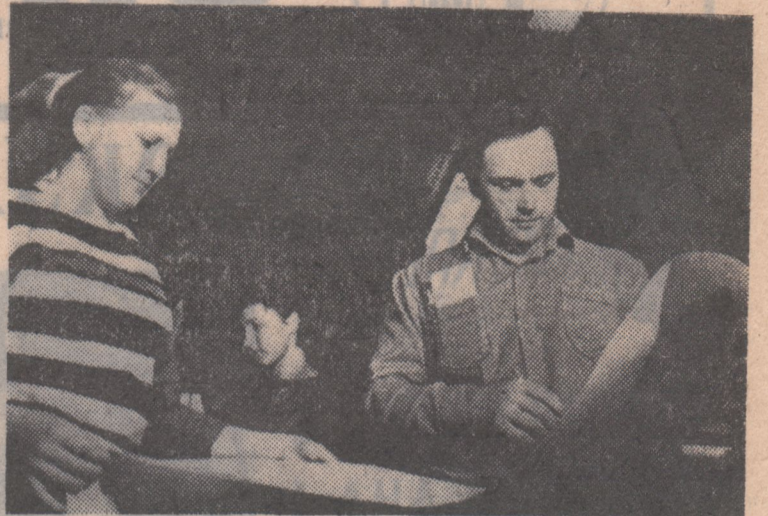
Группа студентов из научного кружка по разработке и эксплуатации системы «СУДАК» (студент — успеваемость — дисциплина — автоконтроль) на физическом факультете занимается отладкой и контрольными пусками программ.