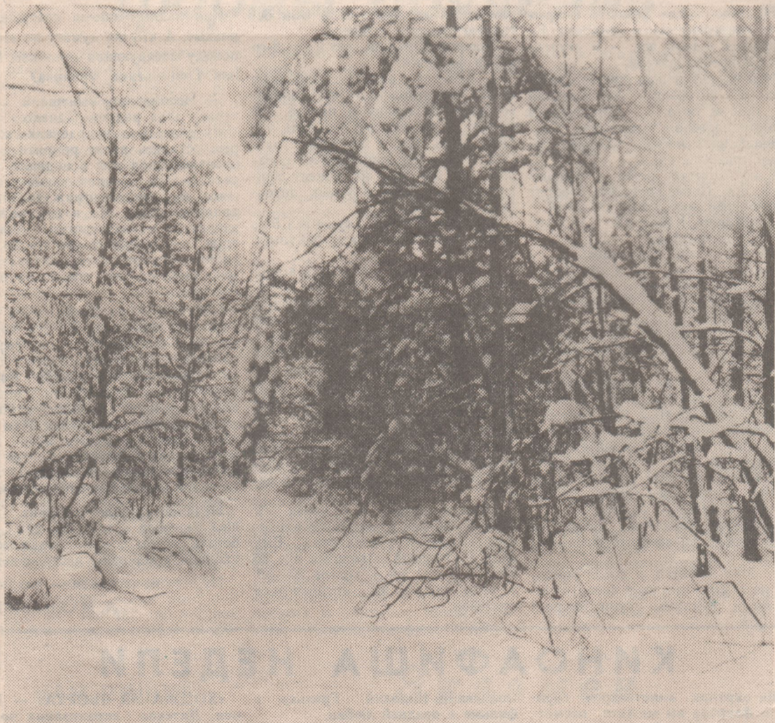
Под голубыми небесами Великолепными коврами, Блестя на солнце, снег лежит; А. С. ПУШКИН.