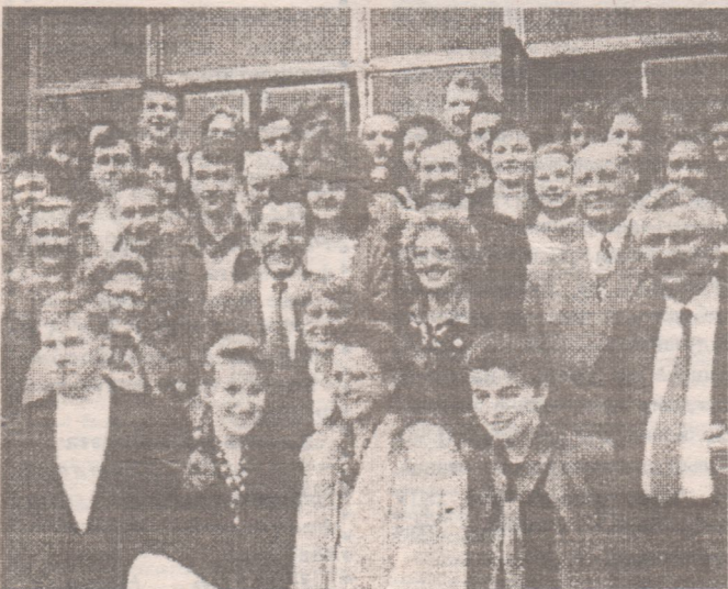
Студэнты і выкладчыкі ўніверсітэта ў дзень сустрэчы з паслом.