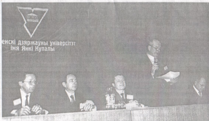
Гродзенскі дзяржаўны ўніверсітэт Імя Янкі Купалы