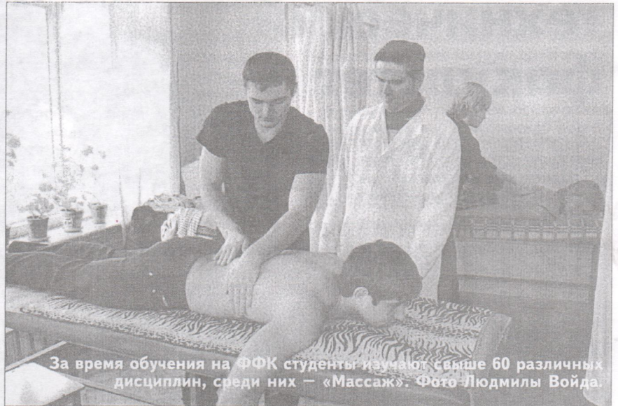
За время обучения на ФФК студенты изучают свыше 60 различных дисциплин, среди них — «Массаж».

низатор физического воспитания в дошкольных учреждениях»;