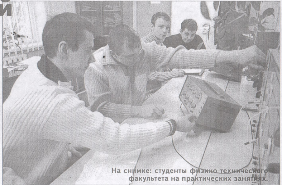
На снимке: студенты физико-технического факультета на практических занятиях.

«Техническая эксплуатация автомобилей» (совместно с Брестским государственным техническим университетом на базе среднего специального образования с сокращенным сроком