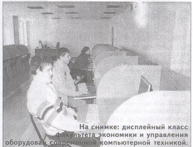
На снимке: дисплейный класс факультета экономики и управления оборудован современной компьютерной техникой.

По специальности «Мировая экономика» ведется подготовка специалистов для сфер внешнеэкономической деятельности, работы в органах государственного управления и регулирования внешнеэкономической деятельности, для работы на