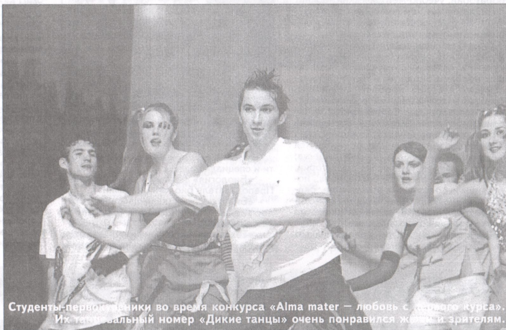
Студенты-первокурсники во время конкурса «Alma mater — любовь с первого курса». Их танцевальный номер «Дикие танцы» очень понравился жюри и зрителям.

Для совершенствования юридического образования и практической подготовки студентов на факультете организована общественная приемная по правовым вопросам. В общественной приемной студенты-юристы под руководством преподавателей, имеющих лицен-