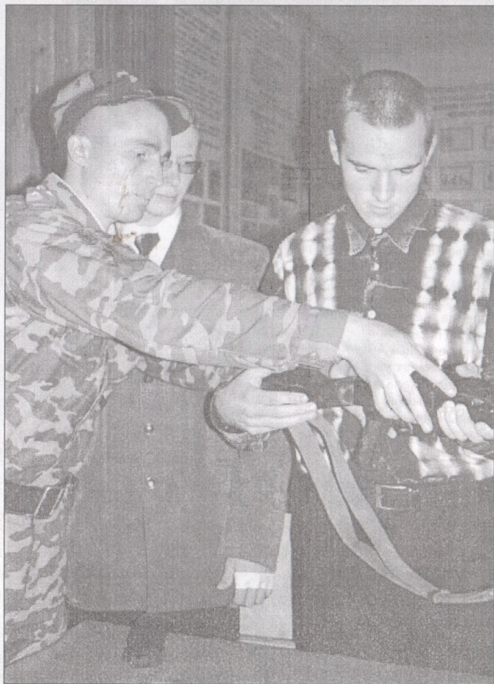
На снимке: студенты постигают военное мастерство.