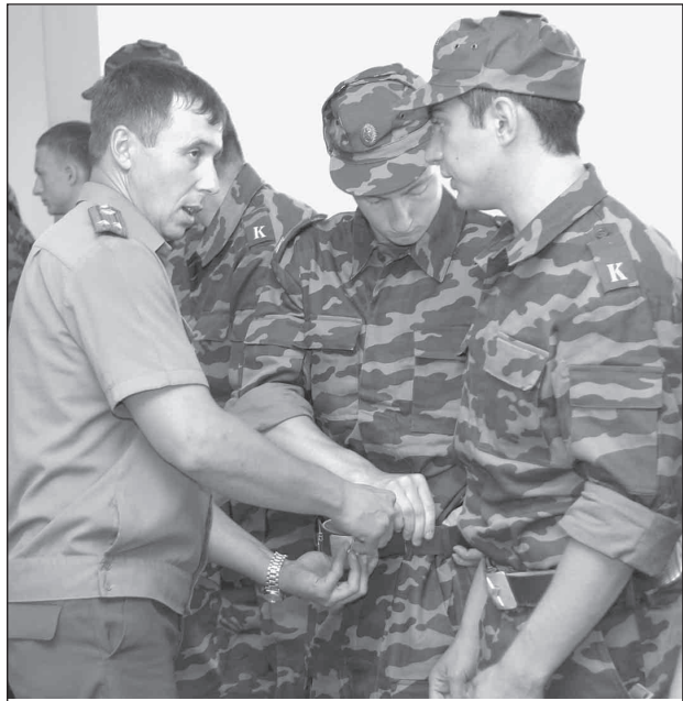
Без помощи отцов-командиров курсантам-первокурсникам пока еще не обойтись.

зали руководители военного факультета, представители Вооруженных Сил и Министерства внутренних дел Республики Беларусь.