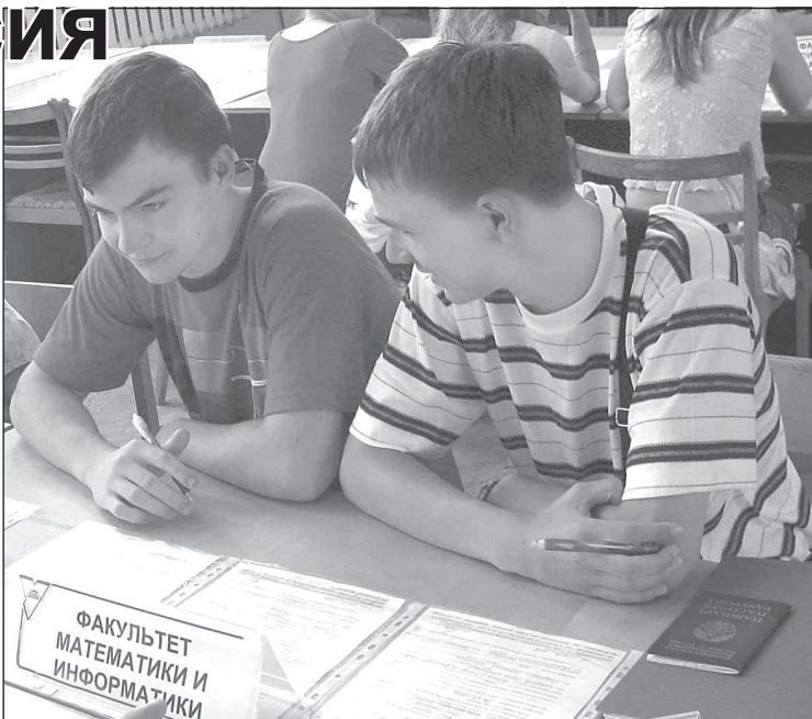
ФАКУЛЬТЕТ МАТЕМАТИКИ И ИНФОРМАТИКИ

21 АВГУСТА гродненцы встречали своего именитого земляка, трехкратного чемпиона мира в метании молота, лучшего спортсмена республики в прошлом году Ивана Тихона, который вернулся на родину после удачного выступления на Олимпиаде-2008.