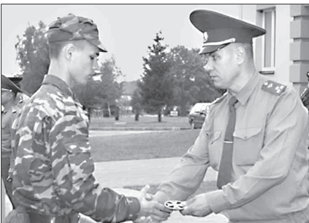
Торжественный момент вручения погон и шевронов новому пополнению.

Учебные будни для курсантов-первокурсников начались с курса общей военной подготовки. Во время прохождения «курса молодого бойца» ребята знакомятся с основами общевоинских уставов и военного