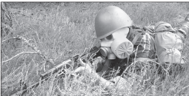
Практические занятия по тактике требуют отменной физической подготовки.