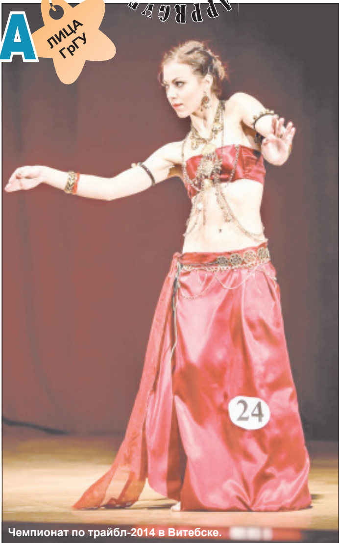
Чемпионат по трайбл-2014 в Витебске.

Беседовала Валерия ЮКНЕВИЧАЙТЕ, студентка 3 курса специальности «Журналистика»