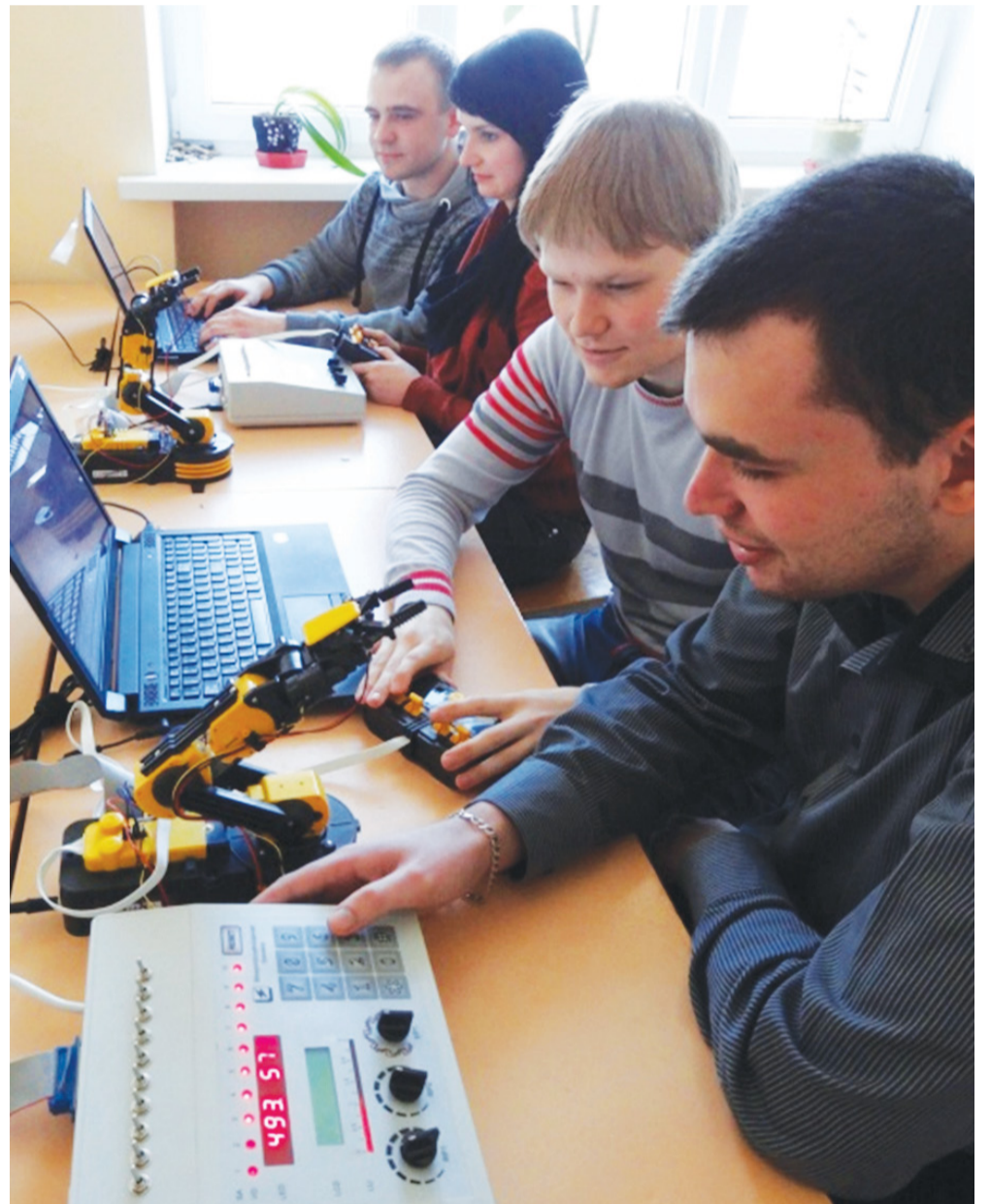
Студенты занимаются отладкой программного обеспечения промышленного контроллера.

Члены СКБ опубликовали 33 научных статьи в сборниках материалов международных научных конференций, приняли участие в реализации двух НИР, выполняемых в рамках государственной программы научных исследований «Электроника и фотоника» и государственной научно-технической программы «Эталоны и научные приборы», а также в разработке 8 наименований выпускаемой РУП «Учебно-научно-производственный центр «Технолаб» продукции. Также ребята сделали 9 внедрений результатов работы в производство, приняли участие в разработке и тестировании экспортного варианта лабораторного комплекса, поставленного в 2015 году по контракту в университет г. Белосток (Республика Польша).