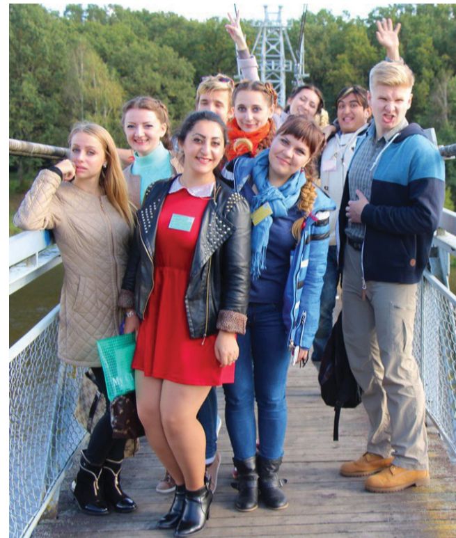
«Театралы» на фестивале клубов ЮНЕСКО в Мостах, где представляли спектакль «Прымакі».