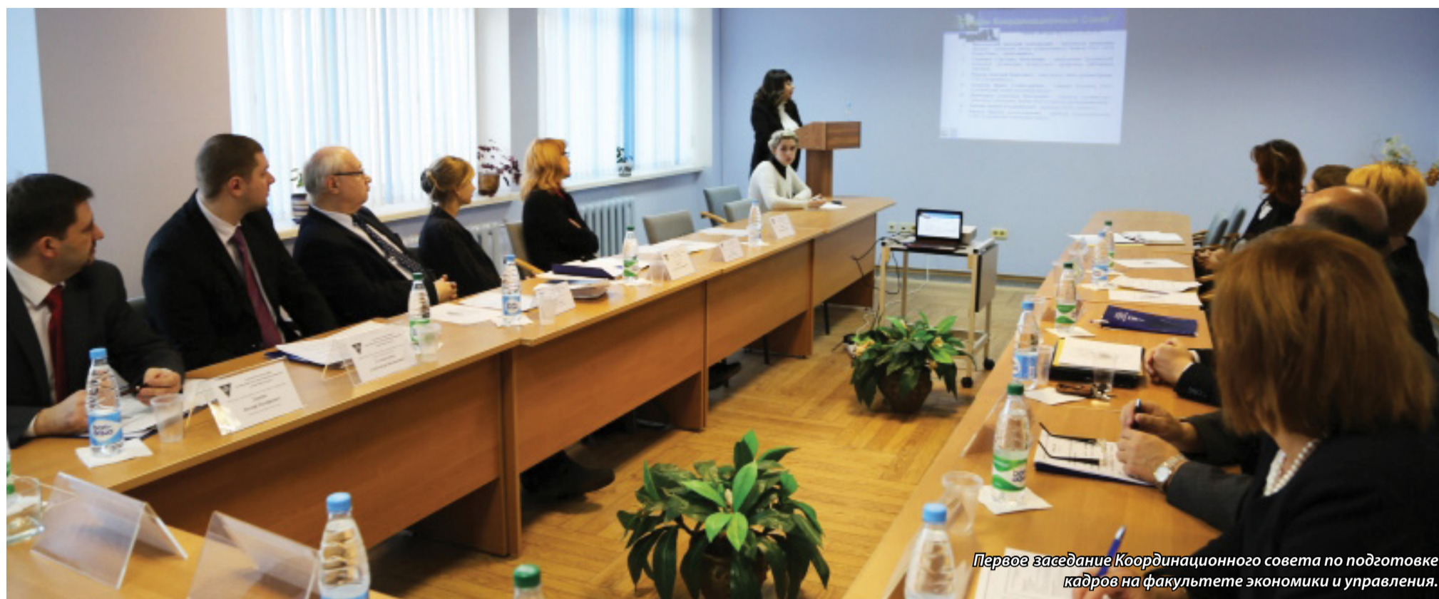
Первое заседание Координационного совета по подготовке кадров на факультете экономики и управления.