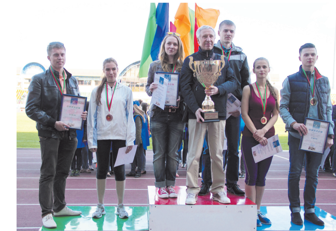
Декан всегда поддерживает своих студентов и вместе с ними радуется победам.