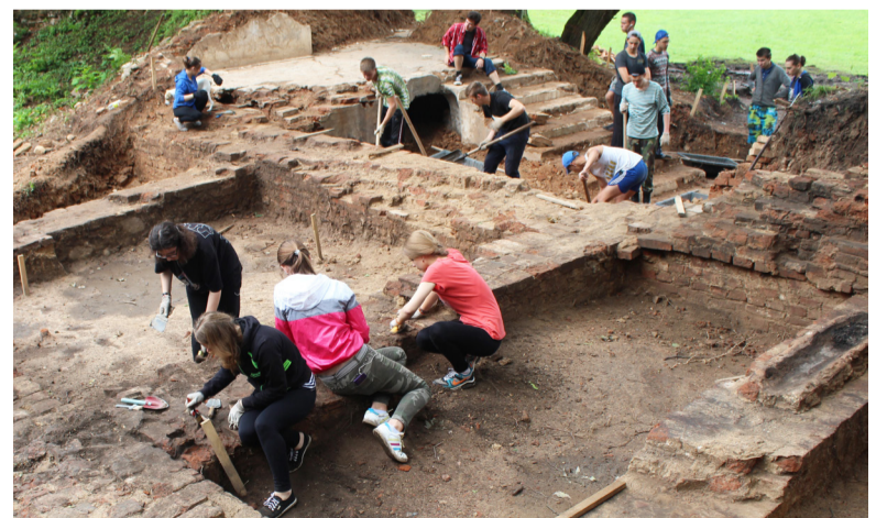
Студенты на раскопках дворца Святополк-Мирских, июль 2016 г.