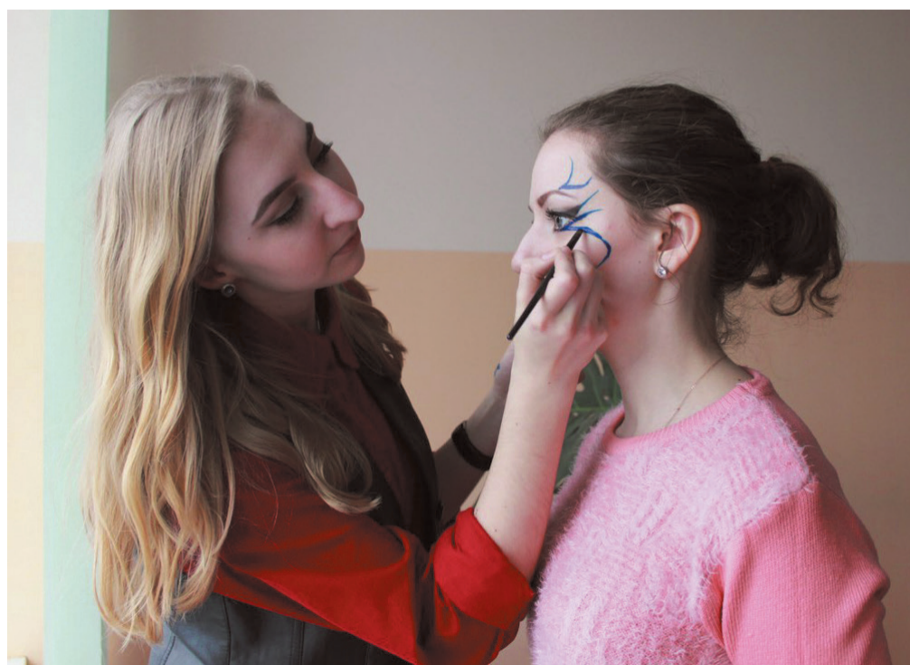
Виктория не только создает образы для свиданий и выпускных, но и гримирует актеров студенческих спектаклей.

– Мне нравится, когда девушка не может поверить своим глазам, глядя на себя в зеркало. Часто приходится слышать: «Ты волшебница. Неужели я такая красивая!».