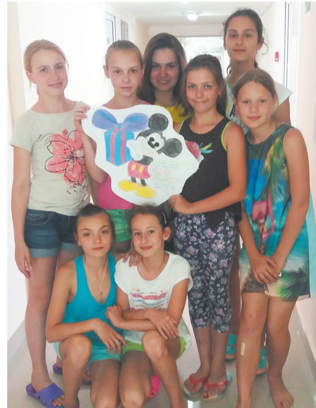
Вожатые не только следят за дисциплиной, но и организуют отдых, придумывают речевки, игры.

– Их довольно много! Запомнился первый день, когда мы только приехали. Вечером не могли не пойти на пляж, а потом со всех ног бежали на планерку, которая про-